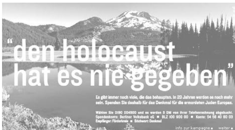
Promotivni poster za spomenik holokaustu u Berlinu

Još je mnogo onih koji vjeruju da ga nije bilo, i za dvadeset godina biti će ih još više. Zato, donirajte za spomenik ubijenim europskim židovima. “